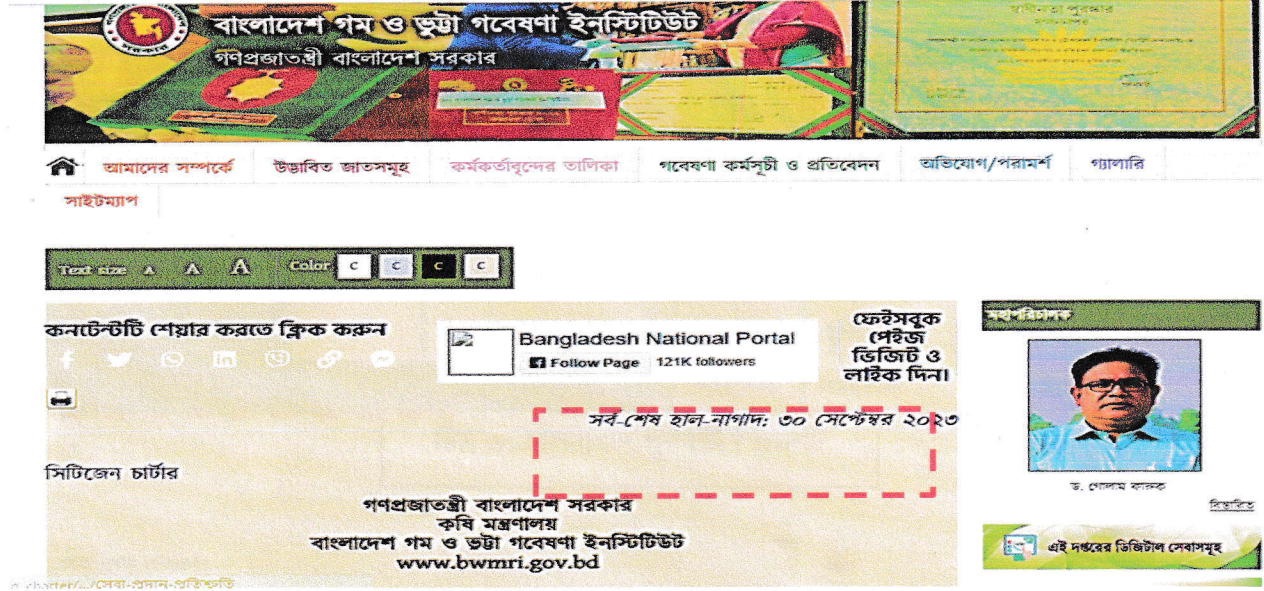
চিত্র ১: হালনাগাদ পূর্ববর্তী স্ক্রিনশট

প্রতিষ্ঠানের ওয়েবসাইটে আপলোডকৃত সিটিজেন চার্টারে নিম্নে উল্লেখিত পরিবর্তন সাধন করে ২৭ ডিসেম্বর, ২০২৩ তারিখে হালনাগাদ করা হয়েছে।