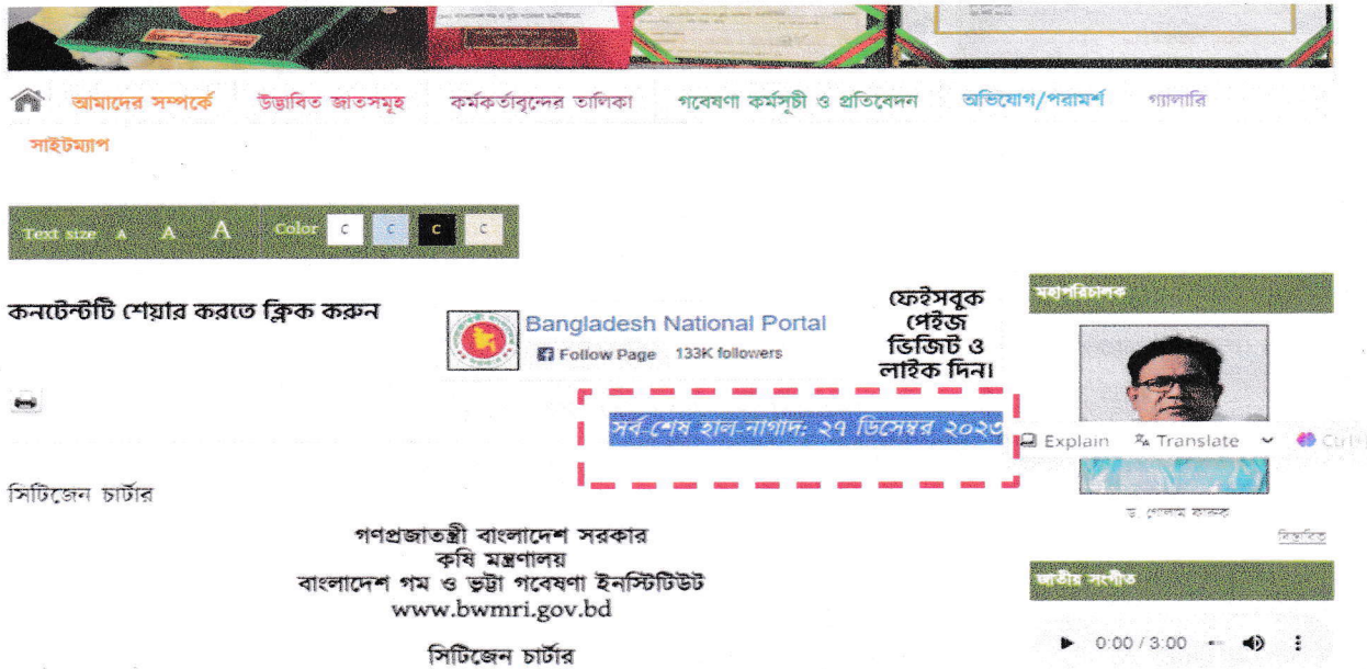
চিত্র ২: হালনাগাদ পরবর্তী স্ক্রিনশট