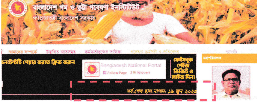
চিত্র ১: হালনাগাদ পূর্ববর্তী স্ক্রিনশট

প্রতিষ্ঠানের ওয়েবসাইটে আপলোডকৃত সিটিজেন চার্টারে নিম্নে উল্লেখিত পরিবর্তন সাধন করে ৩০ সেপ্টেম্বর, ২০২৩ তারিখে হালনাগাদ করা হয়েছে।